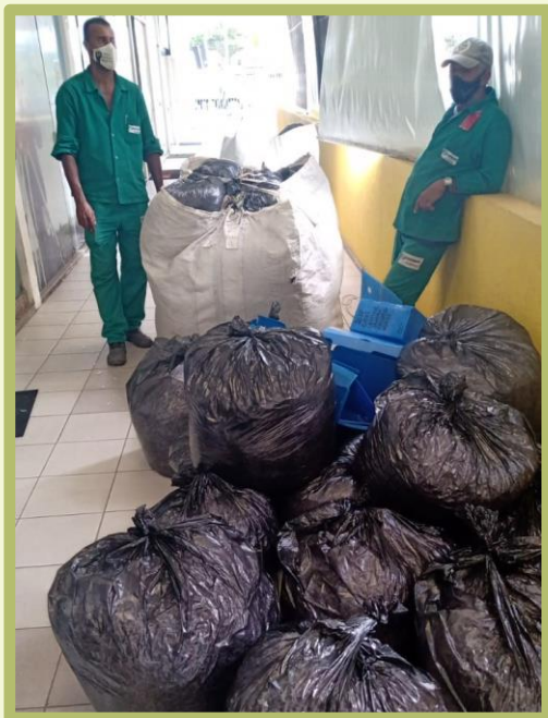
Envio de papel para reciclagem