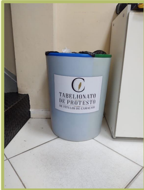
Lixeiras para coleta de materiais recicláveis